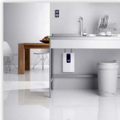
Elektroniczny, kompaktowy ogrzewacz przepływowy DCE. Moc [kW]: 11 lub 13,5. Zastosowanie: do kilku punktów, np.: zlewozmywaków, umywalk, pryszniców. Cechy szczególne: unikalnie płaski (mniej niż 10 cm głębokości), elektronicznie regulowany, stała temperatura w zakresie 20-60°C, system odkrytych grzałek. Wysoka wydajność energetyczna, wielostopniowy system zabezpieczeń, pilot z funkcją pamięci 2 temperatur.