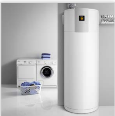
Pompa ciepła powietrze-woda do c.w.u. WWK 301 electronic. Średnia moc [kW]: 1,59. Cechy szczególne: ogrzewanie wody dzięki pompie ciepła do 65°C, pobór ciepła z otoczenia, powietrza wentylacyjnego lub zewnętrzne do temp.: -5°C do +35°C. Króćce przyłączeniowe kanałów powietrznych do podłączenia z boku lub/i z góry, zbiornik c.w.u. 300 l z czujnikiem kalkującym, anodą i wężownicą, panel sterujący LCD, skuteczna izolacja cieplna, wydajny wentylator, klasa A.