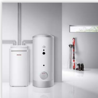
Pompa ciepła solanka-woda WPF 10. Moc [kW]: 10,20. COP: 5,02 (S0/W35 wg EN 14511)! Temperatura zasilania: +60°C. Cechy szczególne: do c.o., c.w.u. i automatycznego chłodzenia pasywnego, nowy regulator WPMi3, płyta tłumiąca hałas i drgania, wbudowany izolowany blok przyłączy elastycznych do bezpośredniego podłączenia bez lutowania/skręcania.