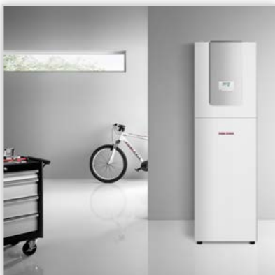
Pompa ciepła solanka-woda WPC 10. Moc [kW]: 10,31. COP: 5,02 (S0/W35 wg EN 14511)! Temperatura zasilania: +60°C. Cechy szczególne: do c.o., c.w.u. i chłodzenia pasywnego, odłączany moduł chłodniczy, nowy regulator WPMi3, płyta tłumiąca hałas i drgania, wbudowany emalowany zasobnik c.w.u. 200 litrów z króćcem cyrkulacji c.w.u.