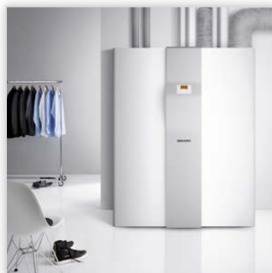
Centrala grzewczo-wentylacyjna z rekuperacją i pompą ciepła LWZ 304-404. Moce [kW]: 4,2; 6. Cechy szczególne: do ogrzewania podłogowego i c.w.u., wentylacji wymuszonej i odzysku ciepła z powietrza zużytego. Wyposażenie: wymiennik powietrze/powietrze, centralny regulator pracy systemu, 200-litrowy zasobnik c.w.u. Centrala zapewnia: oszczędne zużycie energii na ogrzewanie, stały dopływ świeżego powietrza, utrzymanie temperatury pomieszczeń i odpowiednią ilość c.w.u.