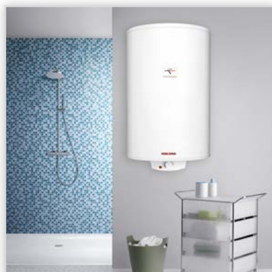
Ogrzewacz pojemnościowy PSH Classic. Moc [kW]: 1,8. Cechy szczególne: ciśnieniowy, energooszczędny, dostępny w 6 pojemnościach: 50, 80, 100, 120, 150 i 200 litrów. Zakres temperatur: 30-70°C. Stalowy zbiornik pokryty specjalną emalią CoPro oraz wyposażony w anodę magnezową. Zastosowanie: do przygotowania ciepłej wody w jednym lub kilku punktach poboru.