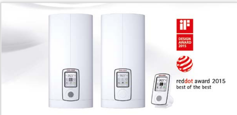
Elektroniczne ogrzewacze przepływowe DHE Connect, DHE Otuch. Światowa nowość już w Polsce: 2 super komfortowe, elektroniczne ogrzewacze przepływowe w technologii 4i, o mocach 18/21/24 kW w jednym urządzeniu oraz 27 kW. Płynna, bezstopniowa regulacja temperatury w zakresie 20-60°C w odstępach co 0,5°C. DHE Connect: graficzny wyświetlacz, funkcje ECO, wbudowane głośniki, pogoda, muzyka, radio internetowe, indywidualny programator, zdalne sterowanie, programy prysznicowe Wellness, automatyka napełniania wanny, programy czasowe. Wskaźnik niebezpieczeństwa poparzenia, przy temperaturze powyżej 43°C. DHE Touch: jak DHE Connect, bez głośników, połączenia WIFI, pogody, radia i muzyki. Pozostałe funkcje identyczne.