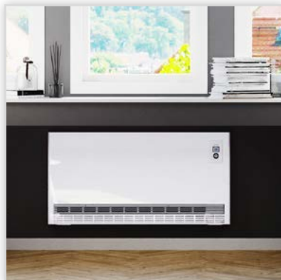
Piec akumulacyjny ETW Plus. Moce zależne od przyłączenia [kW]: od 1,2 do 4,8. Cechy szczególne: seria płaska, tylko 218 mm głębokości, 7 modeli do wyboru, zintegrowany elektroniczny regulator ładowania i regulator temperatury. Panel obsługowy z wyświetlaczem LCD. Funkcja „Start adaptacyjny”, komfortowe tryby pracy. 1 rodzaj wkładów akumulacyjnych, bardzo cicha praca wentylatora.